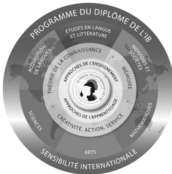
Figure 1 Modèle du Programme du diplôme

Le programme est divisé en six domaines d'études, répartis autour d'un noyau de composantes obligatoires ou tronc commun (voir figure 1). Cette structure favorise l'étude simultanée d'une palette de domaines d'études. Ainsi, les élèves étudient deux langues vivantes (ou une langue vivante et une langue classique), une matière de sciences humaines ou de sciences sociales, une matière scientifique, les mathématiques et une discipline artistique. C'est ce vaste éventail de matières qui fait du Programme du diplôme un programme d'études exigeant conçu pour préparer efficacement les élèves à leur entrée à l'université. Une certaine flexibilité est néanmoins accordée aux élèves dans leur choix de matières au sein de chaque domaine d'études. Ils peuvent ainsi opter pour des matières qui les intéressent tout particulièrement et qu'ils souhaiteront peut-être continuer à étudier à l'université.